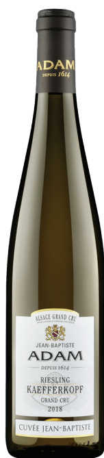
Riesling Grand Cru

סוג יין: לבן זן ענבים: גוורצטרמינר רמת מתיקות: חצי יבש