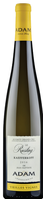
Riesling Grand Cru VV

סוג יין: לבן זן ענבים: ריזלינג רמת מתיקות: יבש