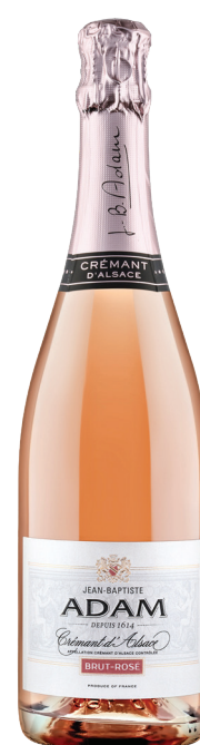
Cremant de Alsace Rose

סוג יין: לבן זן ענבים: ריזלינג רמת מתיקות: יבש