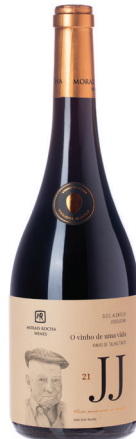
JJ Talha Tinto

סוג יין: יין לבן זן ענבים: אנטאו ואז, ארינטו רמת מתיקות: יבש