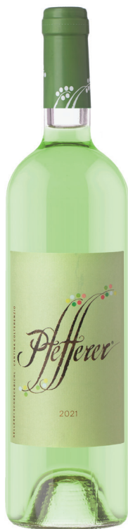
Pfefferer Moscato Giallo

בשנת 1960 הקימו כ-23 מגדלים מאזור העיירה קורניאנו (Cornaiano) שבלב אזור אלטו אדיג'ה קואופרטיב במטרה לייצר יינות איכות. בכרמים נטועים זני ענבים צרפתיים כמו קברנה סוביניון וסוביניון בלאן לצד זנים מקומיים, שיטות עשייה מודרניות ביקב ושאיפה לאיכות בלתי מתפשרת הובילו את יקב קולטרנציו, כיום מונה כ-300 מגדלים, להיות קואופרטיב יין מוביל בכל צפון איטליה