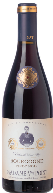
Bourgogne Pinot Noir

סוג יין: יין לבן זן ענבים: שרדונה רמת מתיקות: יבש