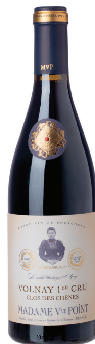
Volnay Clos de Chenes

סוג יין: יין לבן זן ענבים: שרדונה רמת מתיקות: יבש