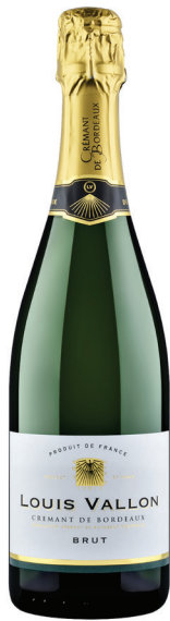
Louis Vallon Crémant de Bordeaux Brut

אחד הקואופרטיבים הגדולים באזור בורדו, נוסד בשנת 1936 וכיום מייצג למעלה מ-300 יצרני יין אשר בבעלותם יותר מ-5,000 הקטר של כרמים בכל רחבי האזור. הקואופרטיב שם לו למטרה לייצר יינות איכות במחירים נגישים וזוהי כלל אינה משימה פשוטה באזור יין מבוקש כבורדו. כל חברי הקואופרטיב מקבלים סיוע בעזרתו הם ממשיכים לייצר יינות נאמנים למסורת ומעבדים את הכרמים מתוך כבוד ואהבה לטבע ואכן כשליש מתוכם בעלי תו תקן אורגני