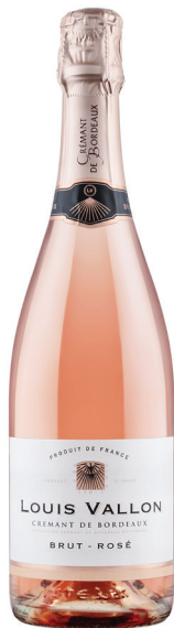
Louis Vallon Crémant de Bordeaux Rose

סוג יין: יין מבעבע לבן זן ענבים: מרלו, קברנה פרנק, סמיון רמת מתיקות: יבש