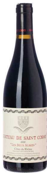
Les Deux Albion Rouge

סוג יין: יין אדום זן ענבים: גרנאש, פינ נואר רמת מתיקות: יבש