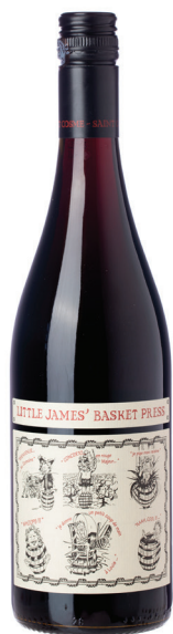
Little James Basket Rouge

סוג יין: יין לבן זן ענבים: סובינון בלאן, ויונייה רמת מתיקות: יבש