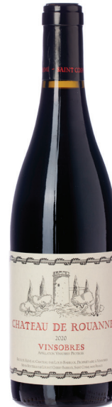
Chateau de Rouanne Vinsobres

סוג יין: יין אדום זן ענבים: גרנאש, סירה, מורבדר רמת מתיקות: יבש